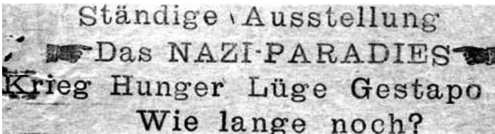
Klebezettel der „Roten Kapelle“ gegen die Propagandaausstellung „Das Sowjetparadies“. Liane Berkowitz war an der Klebeaktion beteiligt.

Es entstanden Kontakte zum Widerstandsnetz um Harro und Libertas Schulze-Boysen und Arvid Harnack (Harnack/Schulze-Boysen-Organisation, sog. "Rote Kapelle").